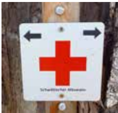
Wegemarke rotes Kreuz

Es gibt zwei Startmöglichkeiten, entweder in Harthausen oder in Bernhausen. Eine kurze Beschreibung: der Weg beginnt in Harthausen und führt nach Grötzingen, gekennzeichnet ist der Weg mit der Wegmarke „rotes Kreuz“