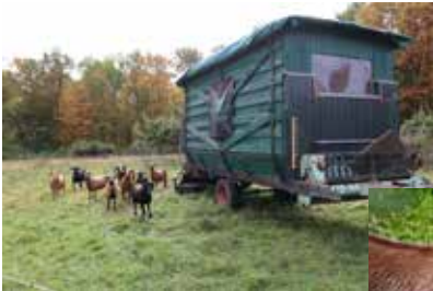
Kamerunschafe Deckherde

Der Weideauftrieb mit 13 Schafen und 13 Lämmern erfolgte am 24. April, die sieben Burengeißen mit den fünf Zicklein folgten einen Tag später. Über die Weidesaison von Ende April bis Ende Oktober waren zeitweise über 50 Tiere auf der ca. 4 ha großen Fläche. Insgesamt erfolgten 36 wechselnde Koppelweiden, mit zwei und teilweise drei Weidegängen. Für die Durchführung der Beweidung wurden von den Verantwortlichen und Beteiligten wiederum rund 160 Stunden geleistet, für Zaunrassen freischneiden, den Auf- und Abbau von rund 7 km Länge Weidezaun und das Versetzen der mobilen Weideunterstände. Der Landschaftserhaltungsverband des Landkreises Esslingen bestätigte bei der Begehung am 22. September die fachliche Durchführung der einzelnen Pflegemaßnahmen durch die OG Bonlanden und die extensive Beweidung mit den Kamerunschafen und Burenziegen durch Landwirt und Tierhalter Daniel Vogel. Herzlichen Dank an die Durchführenden.