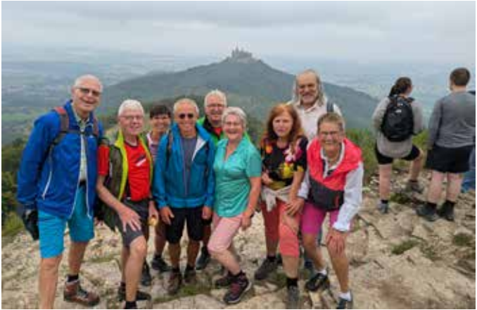
Jubiläums D(T)raufgängertour 2025