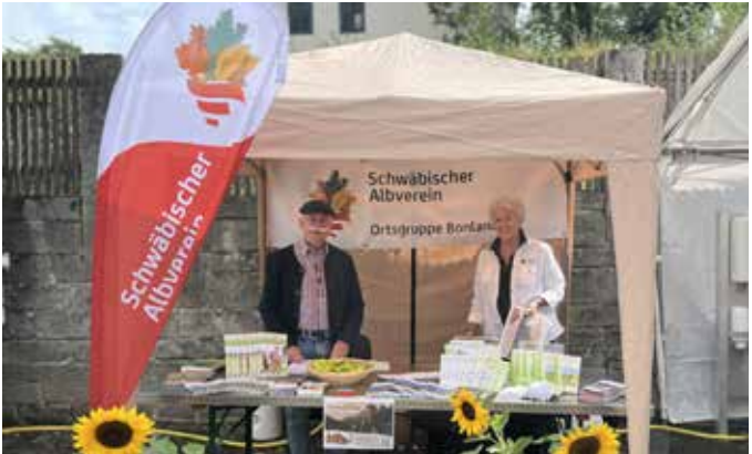
Info Stand Schwäbischer Albverein Bonlanden 2025