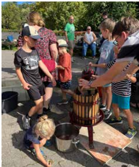
Eigener Apfelsaft herstellen 2025