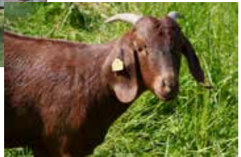
Burenziege Burgl