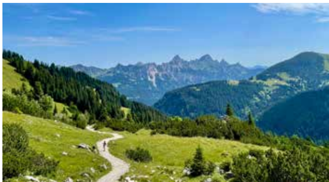
Bergmädeln 2025, Nesselwängle