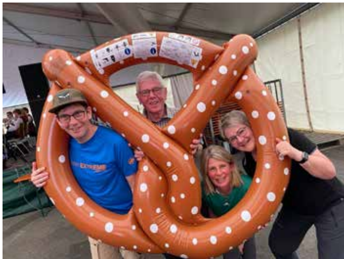
Wanderung zum Brezelmarkt in Altenriet 2025