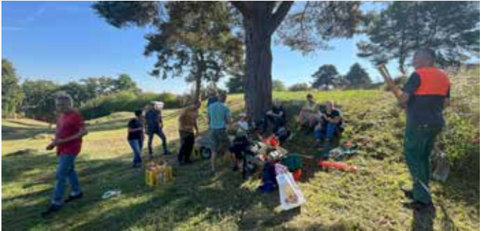
Vesperpause - haben wir uns verdient