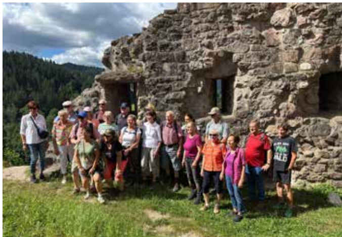
Schwarzwaldtour 2025 Oberkirch

Informationen bitte zeitnah im Amtsblatt oder auf der Homepage beachten!