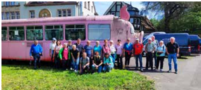
Wanderung Gaisburger Marsch 2025

U.a. Außenanlagen herrichten, Reparatur-/Sanierungs-/Reinigungsarbeiten Gastraum/Gebäude. Für Verpflegung ist gesorgt. Treffpunkt 9.00 Uhr direkt an der Kelter.