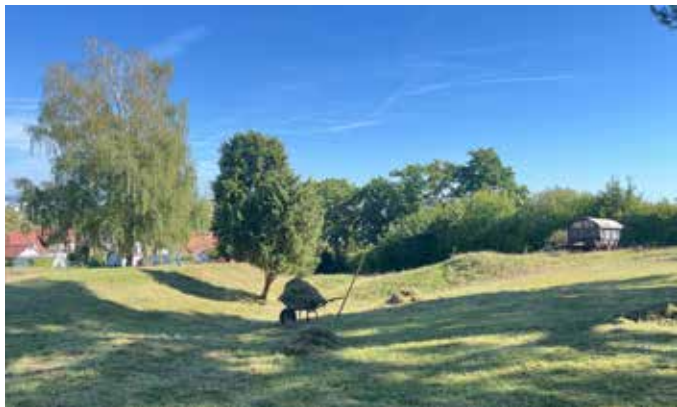
Weidepflege im Nordteil (D. Weinmann)

Die Sommermahd Ende Juli musste mangels Resonanz entfallen. Dafür waren an den Pflagetagen im September und Oktober jeweils 15 Helfer/Helferinnen aktiv bei der Mahd zur Weidepflege und dem Gehölzrückschnitt beteiligt.