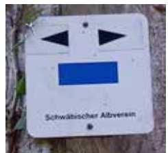
Wegemarke blauer Strich

Ab Grötzingen ist der Wanderweg mit der Wegmarke „blauer Strich“ gekennzeichnet. Der Weg führt uns weiter hoch bis zum Schützenhaus von Bonlanden. Hier führt der Weg hoch zum Uhlbergturm sowie runter nach Bonlanden. Weiter geht es Richtung Bernhausen, wo der Weg beim Gymnasium in Bernhausen endet.